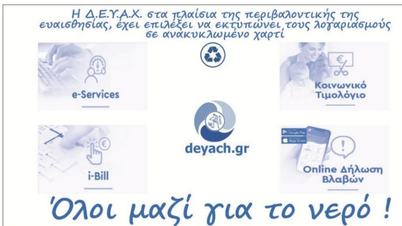
Εικόνα 2: οπίσθια όψη εντύπου λογαριασμού - Δείγμα 2

Το χαρτί που θα χρησιμοποιείται για την παραγωγή του έντυπου του λογαριασμού θα είναι ανακυκλωμένο και θα διαθέτει τα κάτωθι ειδικά χαρακτηριστικά - τεχνικές προδιαγραφές: